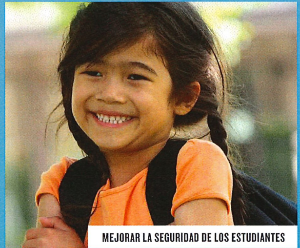
MEJORAR LA SEGURIDAD DE LOS ESTUDIANTES

LAS BOLETAS DE VOTO POR CORREO DEBEN TENER EL MATASELLO ANTES DEL 3 DE NOVIEMBRE DE 2020